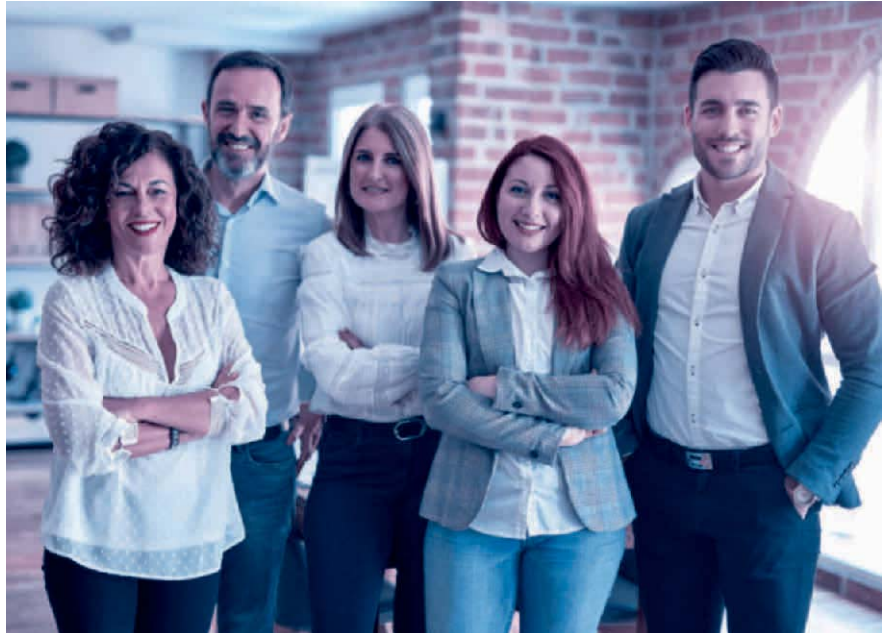
Alles klar: Das Personalreglement schafft eine verbindliche Regelung der Arbeitsbeziehung.

Grundlegender Bestandteil des Personalreglements ist das Arbeitszeitmodell des Unternehmens. Also beispielsweise die gleitende Arbeitszeit mit definierten Blockzeiten, Regelungen zum Homeoffice und die im Betrieb übliche Wochenar-